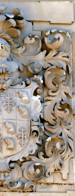
Palacio de Iturri.

Los escudos barrocos se desarrollan a partir del siglo XVII, época dorada de la heráldica en Elorrio. Son los más abundantes y representativos de los palacios de la villa y se ubican en edificios suntuosos y monumentales, lo que proclama la prosperidad de sus dueños.