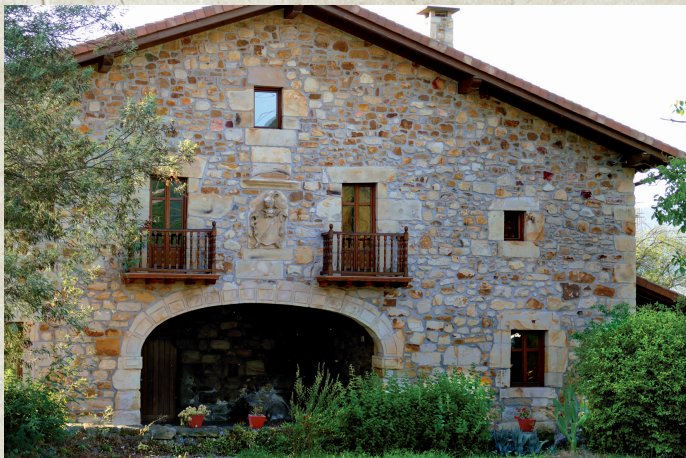
Urkizuaran auzoan, Urkizu San Bizentekoa baserria. Caserío Urkizu San Bizentekoa en el barrio de Urkizuaran.

Estilo eta kronologiaren arabera, hiru multzotan sailka daitezke Elorrioko eraikinetan dauden 69 armari edo blasoiak: armari gotikoak edo gotiko berantiarrak, errenazimentuko armariak eta armari barrokoak.