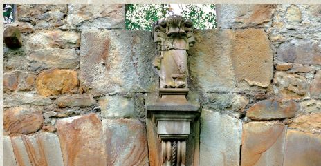
Erortzean dagoen Urkizu Elexalde baserriko armarría. Escudo del caserío en ruinas de Urkizu Elexalde.

Hainbat baserri zeuden Urkizuaran auzoan eta, Elorrioko beste etxe batzuek bezala, leinu honen armari heraldikoak agertzen dituzte.