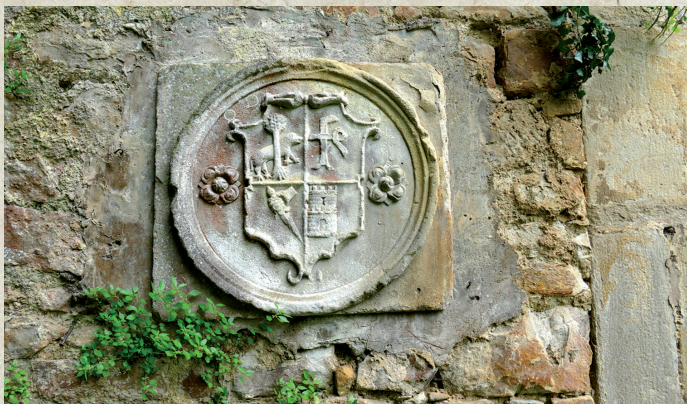
Amarria Esteibartarren desagertutako jauregiarena zen; bere gainean, gaur egungoa eraiki zuten. Escudo de Esteibar perteneciente al palacio ya desaparecido sobre el que se levantó el actual.

Los escudos renacentistas siguen siendo austeros, aunque es más habitual que tengan algo más de resalte y que su estructura o partición empiece a complicarse, incorporando diversos pabellones o cuarteles. Además, suelen presentar un contorno o forma más elaborada, como el de Esteibar, situado en la fachada del palacio Esteibar Arauna que da a la huerta, o el situado en la fachada lateral de la torre de Urkizu, sita en la calle Berrio-Otxoa.