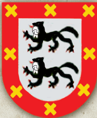
Haro leinuaren harmarria (Bizkaiko nagusiak) Escudo de la casa de Haro (Señores de Bizkaia)

Behe Erdi Aroan hain zuzen ere, lehen familia armari heraldikoak sortu ziren Bizkaian. XIII. mendean, otsoa zen Haro leinuaren armaria, baina denborarekin otsoa Bizkaiko Jaurerriaren armariaren parte izatera pasa zen.