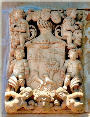
Mendraka auzoko Ulaortua baserriaren harmarria (Elorrio). Escudo heráldico del caserío Ulaortua en el barrio de Mendraka (Elorrio).

Egun kutsu arrazista badu ere, baldintza hori betez gero, herri-tarrak kapare kondizio sozial zabalduenaren barruan sartzen ziren, 1526ko Bizkaiko Foru Berriaren arabera. Kapare izateak salbuespen fiskalak izatea ahalbidetzen zuen, baita armarrria izateko aukera ere, guzti-guztiek ez zeukaten arren.