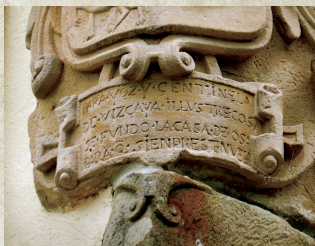
Armarriaren entseina Otsabarrena baserrian (Aldape). Divisa del escudo en el caserío Otsabarrena (Aldape).

El escudo de Otsabarrena, en el barrio de Aldape, lleva al pie una inscripción que dice así: “Para voz y centinela de Vizcaya, ilustre cosa, se fundó la casa de Ossa para q(ue) simpresten (siempre estén en) vela” .